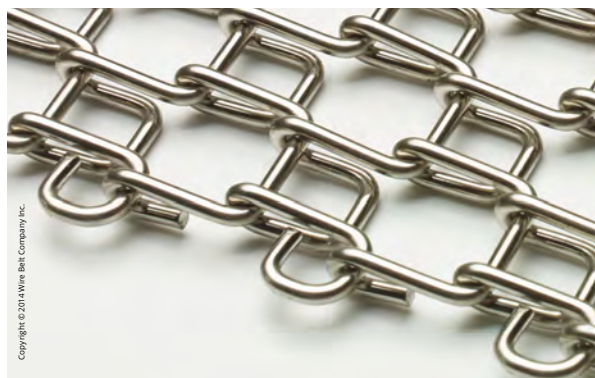
Compact-Grid™ Fördergurt mit C-CureEdge®

Wire Belt Company Osterloh GmbH Ringstraße 20, 23923 Selmsdorf, Germany Tel: +49 (0) 38823 5445-0 | Fax: +49 (0) 38823 5445-19 | Email: sales@wirebelt.de