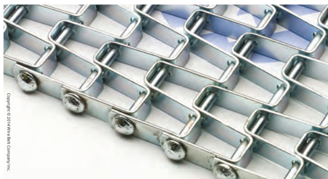
Wabengurt mit verschweißten Kanten

Wire Belt Company Company Osterloh GmbH Ringstraße 20, 23923 Selmsdorf, Germany